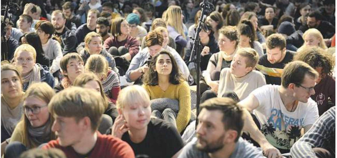
Un momento de la oración de la tarde del Encuentro de Taizé en Madrid