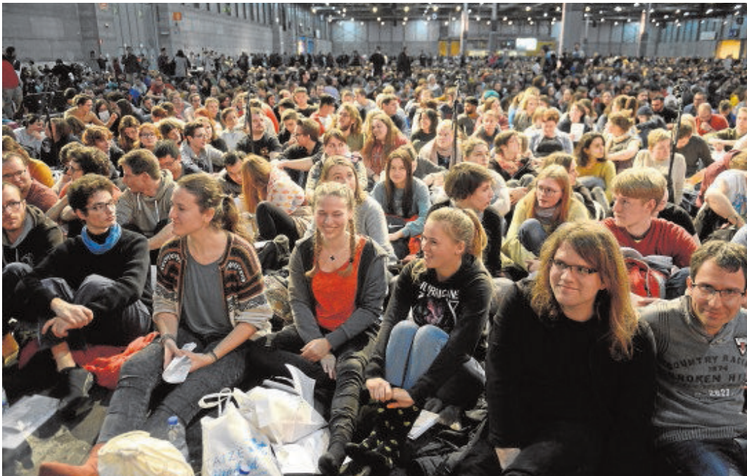
El recinto ferial de Ifema acoge a los jóvenes que participarán en las jornadas de oración