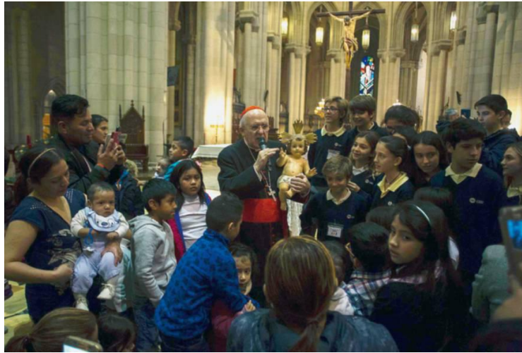
Le cardinal Osoro Sierra à la cathédrale de l'Almudena à Madrid, le 21 décembre 2017.

Quel regard portez-vous sur l'Église espagnole aujourd'hui ? Card. C. O. S. : En Espagne, l'Église catholique se trouve plus ou moins dans la même situation que dans le reste de l'Europe, à savoir dans une société sécularisée.