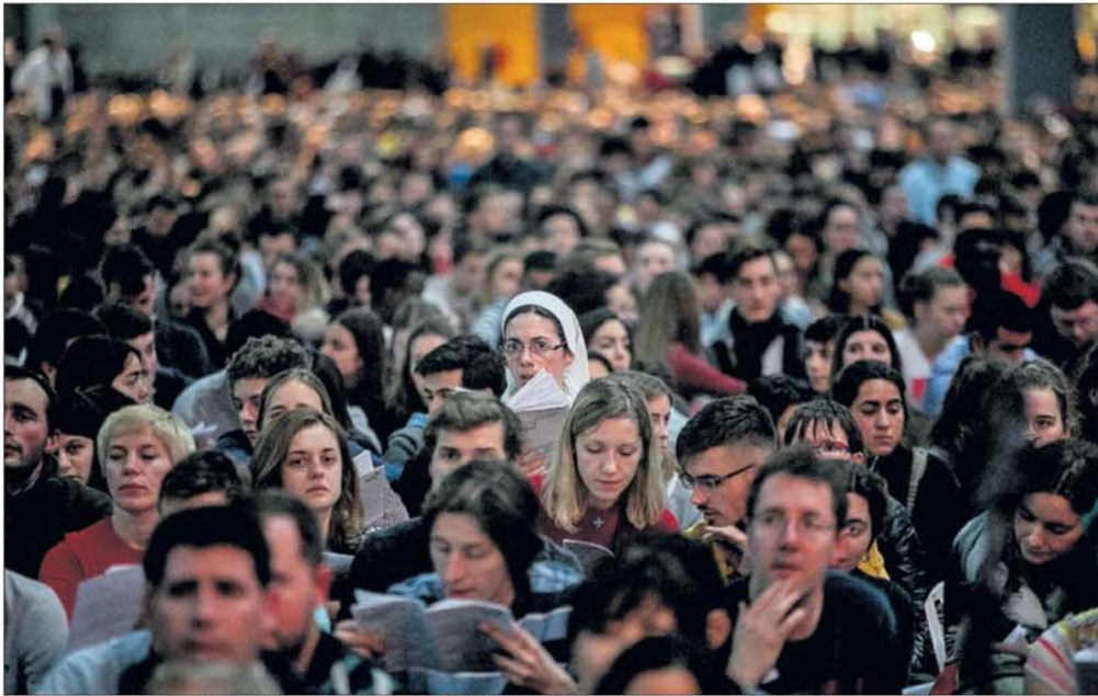
Encuentro europeo organizado por la comunidad de Taizé de jóvenes cristianos, ayer en el recinto de IFEMA en Madrid.