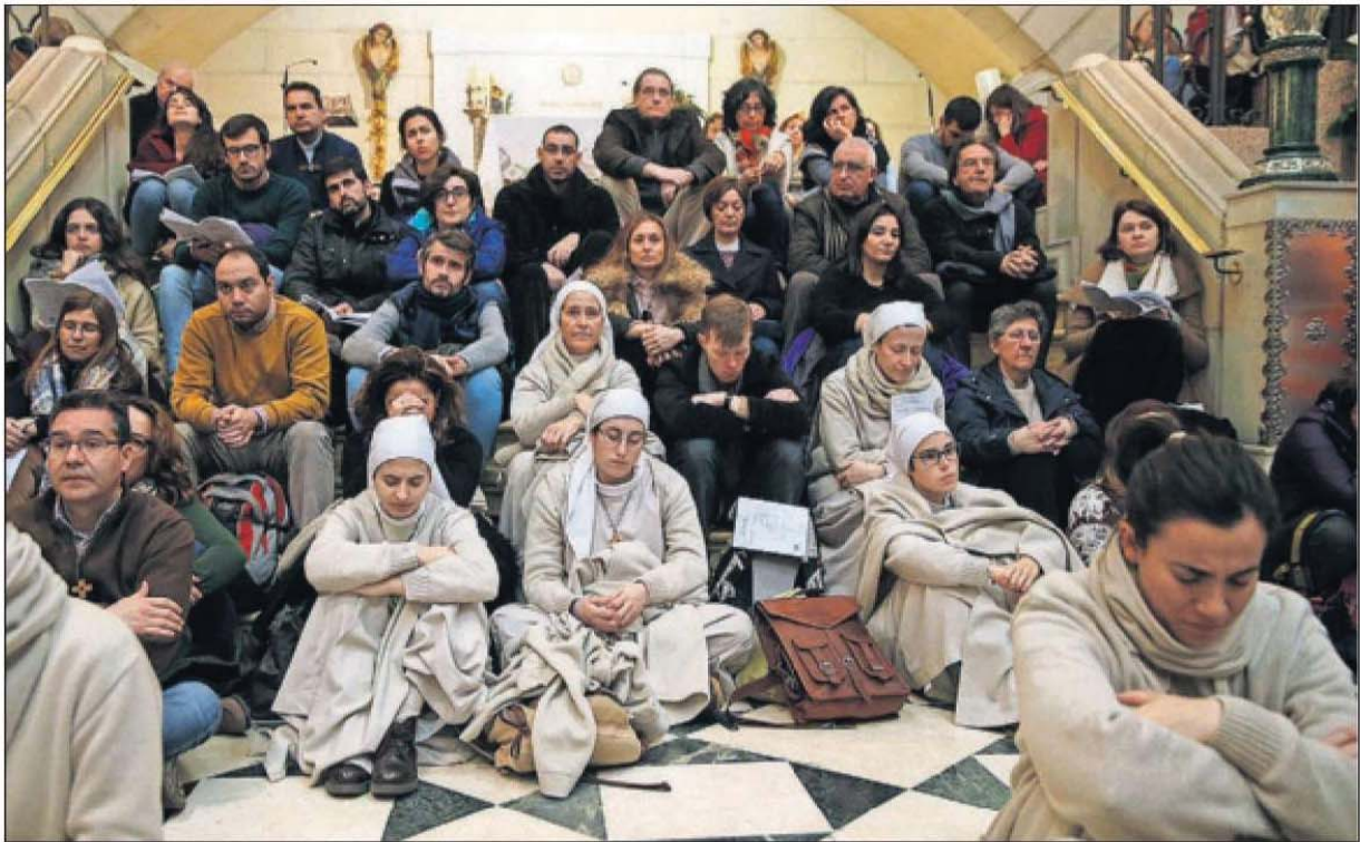
Jóvenes cristianos, ayer durante la misa en la catedral de la Almudena de Madrid.