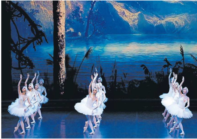
Protagonistes. Els ballarins principals van demostrar un alt nivell amb esveltesa aristocràtica.

L'agrupació, que compta amb prop de setanta ballarins en escena, està allionada en la justesa de les intervencions col·lectives, és refinada, posseeix rica plasticitat escènica, executada acurades cadències i s'ajusta als dictàmens de l'orquestra proposant moments de singular bellesa i escrupolositat rítmica. Les danses de parelles o grups en les dues festes de l'obra, van permetre valorar l'excel·lència i notable entrenament dels conjunts, així com la delicadesa del cos femení en tots dos actes en les escenes del llac, conformant una nodrida col·lectivitat de cignes