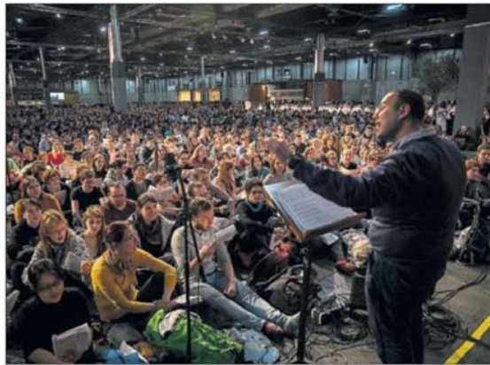
Un momento del encuentro organizado por la comunidad Taizé.

La atracción de Taizé como símbolo de encuentro de religiones es creciente como demuestran las visitas a ese monasterio de líderes tan destacados como el papa Juan-Pablo II, el patriarca Bartolomé de Constantinopla, varios metropolitanos ortodoxos, cuatro arzobispos de Canterbury y numerosos obispos, sacerdotes y pastores católicos, orto-