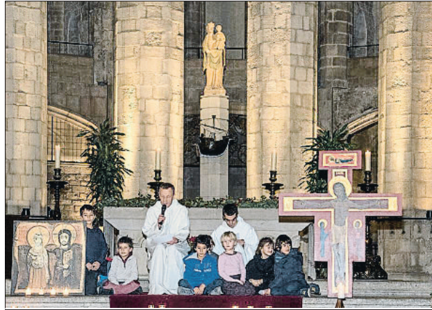
Un momento del encuentro con la comunidad de Taizé en Santa María del Mar