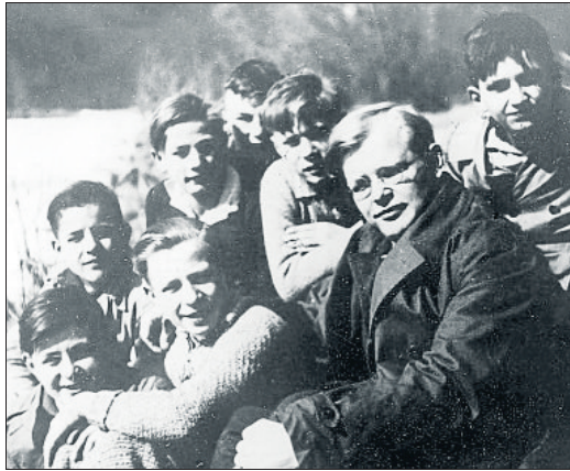
Dietrich Bonhoeffer con un grupo de estudiantes, en 1932

Bonhoeffer insistió en el carácter arreligioso del cristianismo y del Dios revelado por Jesús y para él la crisis moderna sobre Dios es una crisis del Dios de la religión, no del Dios de Jesucristo.