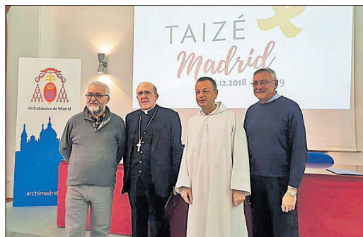
La presentació de la trobada, aquest dimecres, a Madrid. EUROPA PRESS

La trobada va començar ahir amb un sopar i una oració al Pavelló número 4 de la Fira d'Ifema