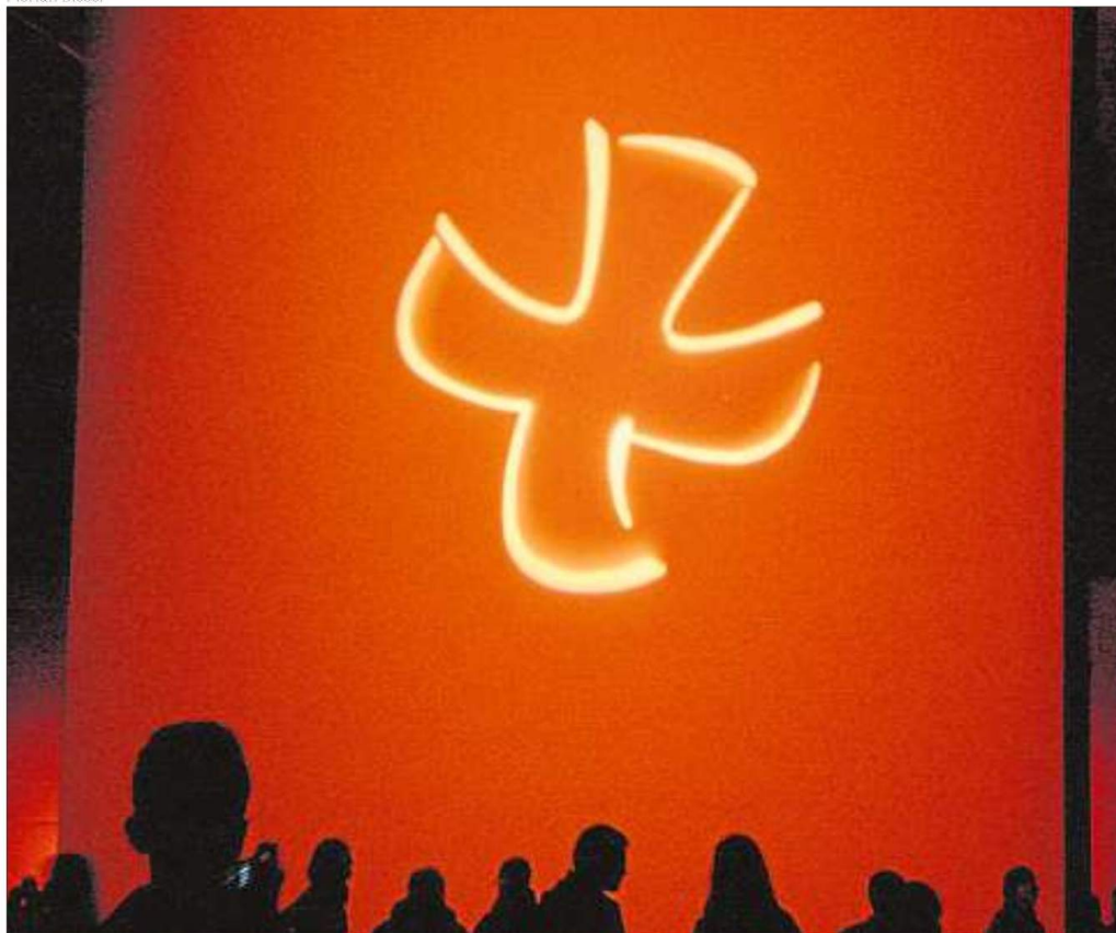
La cruz de Taizé en uno de los últimos Encuentros Europeos de Jóvenes