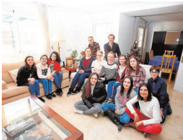
Los participantes han sido acogidos por familias madrileñas

Este religioso protestante de origen suizo decidió poner en marcha estos encuentros europeos después de ver que muchos de los jóvenes que pasaban por el monasterio de Taizé en Francia no sabían cómo continuar esa experiencia de fe cuando regresaban a sus hogares. Para apoyarles y poder acompañarles en sus ciudades y parroquias de origen la comunidad de Taizé comenzó a convocar estos encuentros anuales multitudinarios en