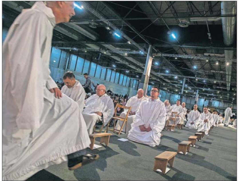
Religiosos en la concentración de Taizé, ayer en Madrid.

Los encuentros Taizé van a continuar todo el año, entre otros en Beirut (Líbano) y Ciudad del Cabo (Sudáfrica), en muchas ocasiones convocando a cristianos y musulmanes, aunque es la ciudad polaca de Brieslavia la elegida para acoger dentro de un año la reunión más multitudinaria, como la que ahora concluye. El anuncio de esa elección por el prior de Taizé, el hermano Alois, desató la euforia de los 3.500 polacos que han venido a Madrid, sobre una cifra de cerca de 15.000, según los datos finales de la organización. Del festejo de sus jóvenes fieles