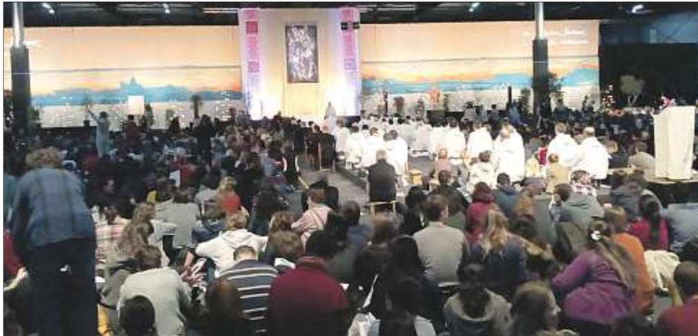
Oración junto a los hermanos de Taizé y el cardenal Osoro, en Ifema

Después se encaminaban al centro de la ciudad para participar en la oración del mediodía en diferentes iglesias y asistir, posteriormente, a los numerosos talleres sobre la fe, la espiritualidad o el arte que tuvieron lugar en diversas parroquias y otros foros, donde los jóvenes mostraron su inquietud y su interés a la hora de hacer preguntas y participar de manera activa en grupos.